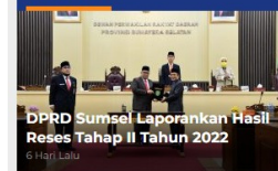
DPRD Sumel Laporkan Hasil Reses Tahap II Tahun 2022