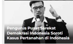
Pengurus Pusat Sarekat Demokrasi Indonesia Soroti Kasus Pertanahan di Indonesia