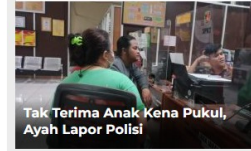
Tak Terima Anak Kena Pukul, Ayah Laporkan Polisi