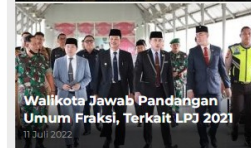
Walikota Jawab Pandangan Umum Fraksi, Terkait LPJ 2021