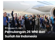
February 25, 2023 Pemulangan 26 WNI dari Suriah ke Indonesia