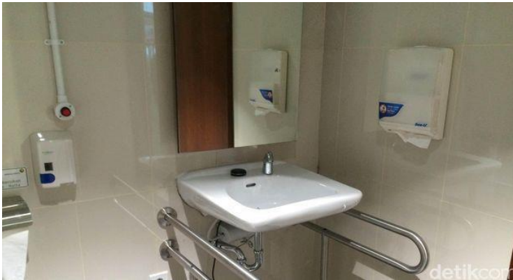
Wastafel Disabilitas

wastafel harus dipasang sedemikian rupa sehingga dapat membantu disabilitas bergerak dengan leluasa. Untuk faktor keselamatan, wastafel dilengkapi dengan pegangan tangan (handle)