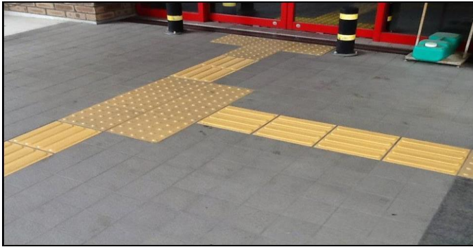
Guiding Block