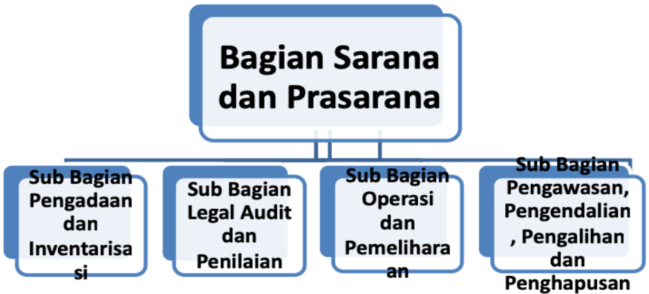
Gambar 3.2 Organisasi Pelaksana Pengelola Sarana Prasarana

Berdasarkan alur proses dalam manajemen pengelolaan sarana prasarana, maka secara umum organisasi pelaksana sarana prasarana dapat dikategorikan menjadi dua bagian penting. Kategori atau bagian yang pertama adalah bagian pengadaan, audit, dan penilaian. Kemudian bagian yang kedua adalah bagian operasi, pemeliharaan, pengendalian, pemeliharaan dan penghapusan. Kedua kategori atau bagian tersebut, dapat digunakan sebagai dasar dalam menyusun organisasi pelaksana dalam manajemen sarana prasarana pendidikan yang ada. Adapun struktur atau organisasi pelaksana pengelola sarana prasarana pendidikan adalah seperti pada gambar berikut.