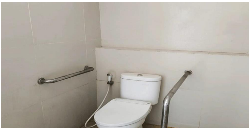
Toilet Disabilitas