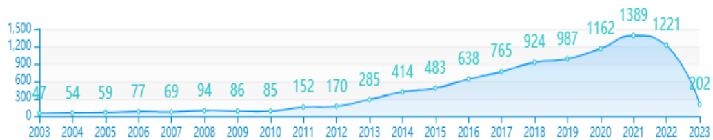
Gambar 1. Diagram Jumlah Publikasi Universitas Islam Negeri Raden Fatah Palembang.

Menurut data pada Scimago Journal & Country Rank tahun 2023, Indonesia saat ini menempati peringkat ke-39 dari 242 negara berdasarkan publikasi internasional dan publikasi ilmiah terindeks Scopus Indonesia sebanyak 312.182 dokumen.