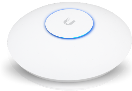
AP UNIFI AC HD