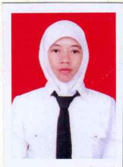
Mariyamah Tanda Tangan Pemilik Signature of holder

Atas Nama Badan Nasional Sertifikasi Profesi On Behalf of Indonesian Professional Certification Authority Lembaga Sertifikasi Profesi PT. LSP Halal Indonesia Professional Certification Body PT. LSP Halal Indonesia