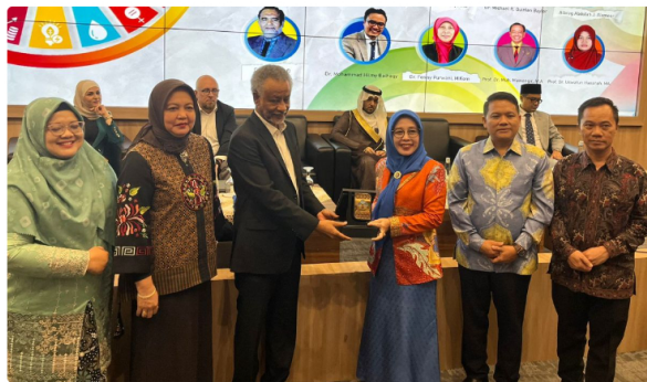
UIN Raden Fatah Palembang sukses menjadi tuan rumah ISSHMIC 2023 yang menghadirkan pembicara dari 7 negara

Reporter: Trisno Rusli | Editor: Trisno Rusli | Kamis, 09 Nov 2023 - 12:23