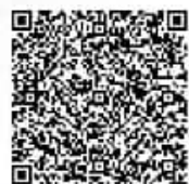
mengetahui Dr. H. Syahrul Yasin Limpo, S.H., M.Si., M.H. Menteri Pertanian

Telah mengikuti Bimbingan Teknis dan Sosialisasi Tanaman Pangan `Menjamin Kehalalan dan Keamanan Rantai Pasok Produk Tanaman Pangan dan Turunannya ( Episode 481 )` Tanggal 07 Juni 2022