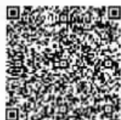
mengetahui Dr. H. Syahrul Yasin Limpo, S.H., M.Si., M.H. Menteri Pertanian

Telah mengikuti Bimbingan Teknis dan Sosialisasi Tanaman Pangan `Menjamin Kehalalan dan Keamanan Rantai Pasok Produk Tanaman Pangan dan Turunannya ( Episode 481 )` Tanggal 07 Juni 2022