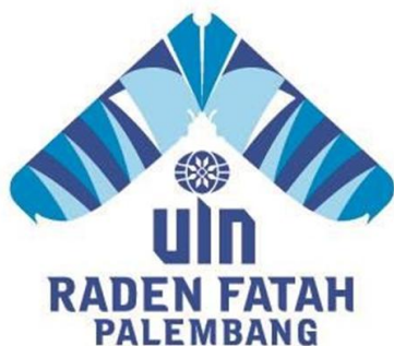
Gambar 1.1 Lambang UIN Raden Fatah Palembang

Salah satu ciri dari sebuah lembaga perguruan tinggi adalah lambang yang dimiliki oleh perguruan tinggi tersebut. Lambang yang dimiliki menjadi salah satu dasar bagi pengembangan UIN Raden Fatah pada masa mendatang. Gambar lambang UIN Raden Fatah Palembang dapat dilihat pada Gambar 1.1.