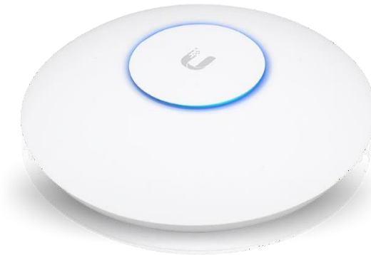
AP UNIFI AC HD