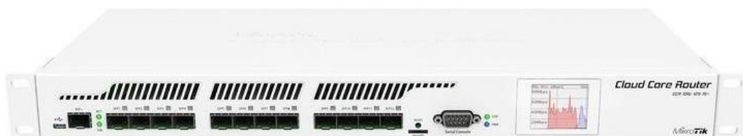
MIKROTIK CCR 1016-12S-1S+