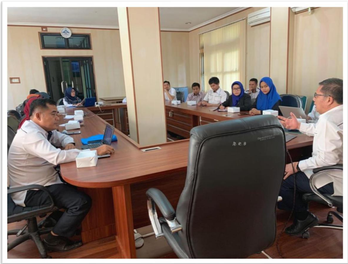
PHOTO DOKUMENTASI RAPAT EVALUASI IMPLEMENTASI LAYANAN BERBASIS TEKNOLOGI INFORMASI DAN KOMUNIKASI (TIK) 18 DESEMBER 2021