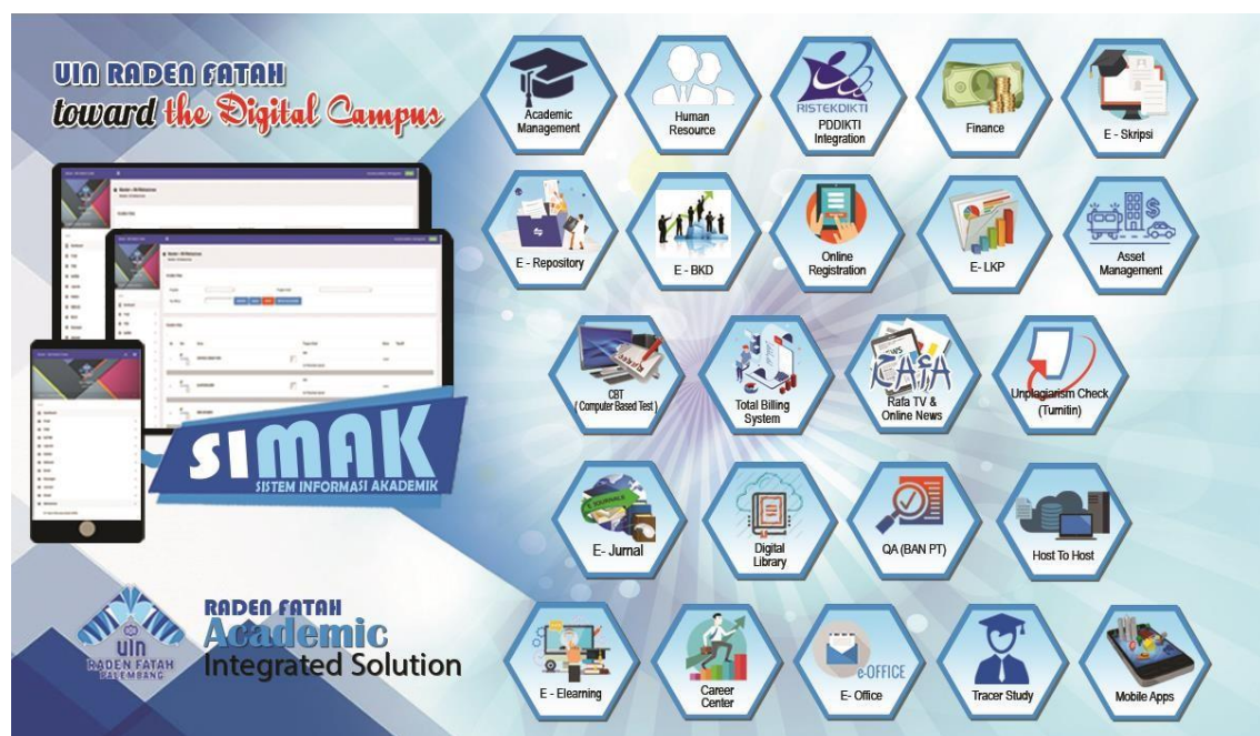
Pengembangan Aplikasi berbasis online

Pada tahun 2014 melalui Perpres No. 129 Tahun 2014 tentang Perubahan IAIN Raden Fatah Palembang menjadi UIN Raden Fatah Palembang menjadi sejarah tranformasi lembaga dari IAIN menjadi UIN. Perubahan ini tentunya menjadi kompas dan arah serta menjadi agenda strategis bagi pengembangan UIN Raden Fatah Palembang di masa-masa mendatang terutama berdampak pada pengembangan Teknologi Informasi untuk mengikuti kebutuhan dunia Industri. Universitas Islam Negeri Raden Fatah Palembang secara umum telah melaksanakan kegiatan dengan lancar dan sesuai dengan rencana kegiatan yang telah ditetapkan sebelumnya. Pelaksanaan kegiatan berbasis Teknologi