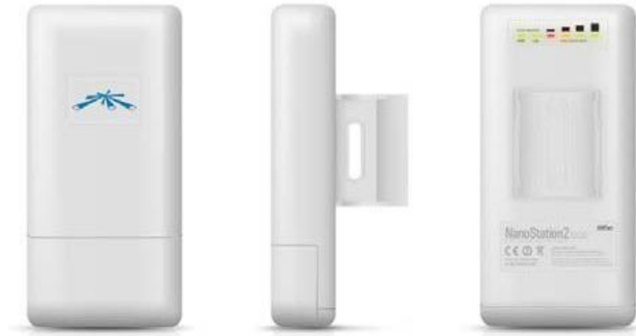
AP UBNT NANO STATION 2