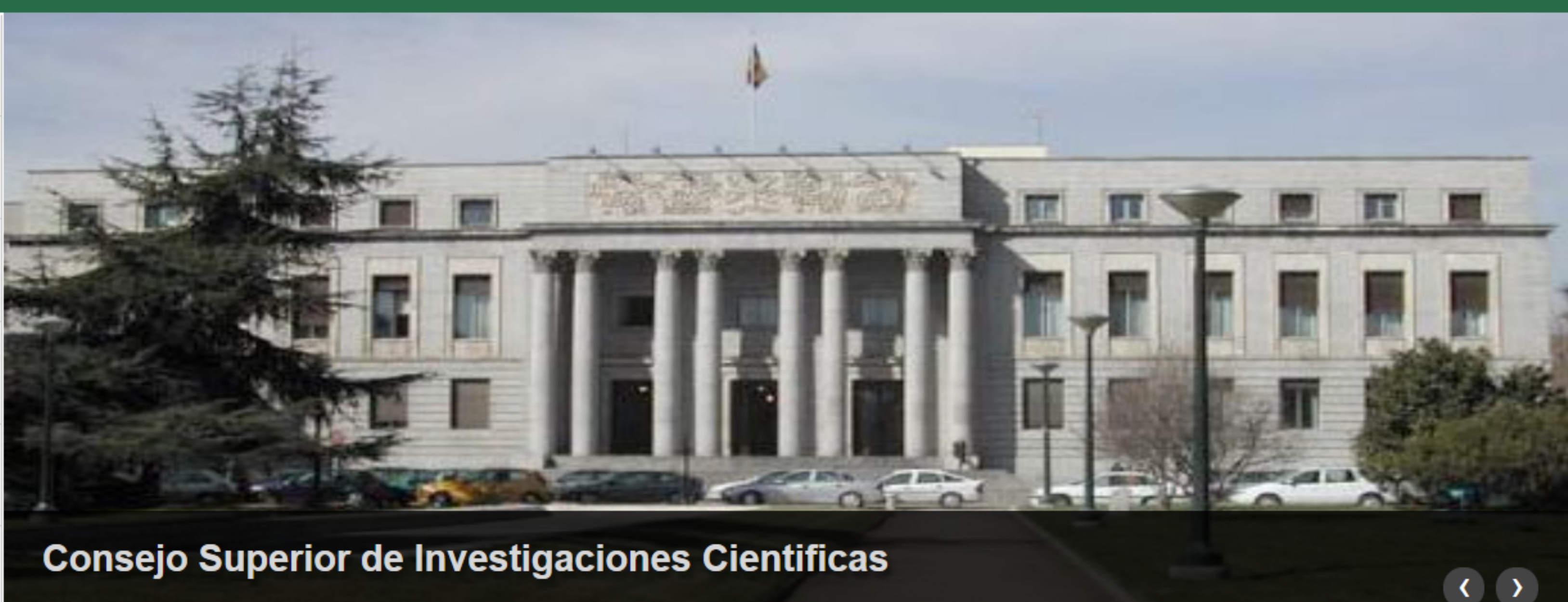
Consejo Superior de Investigaciones Cientificas