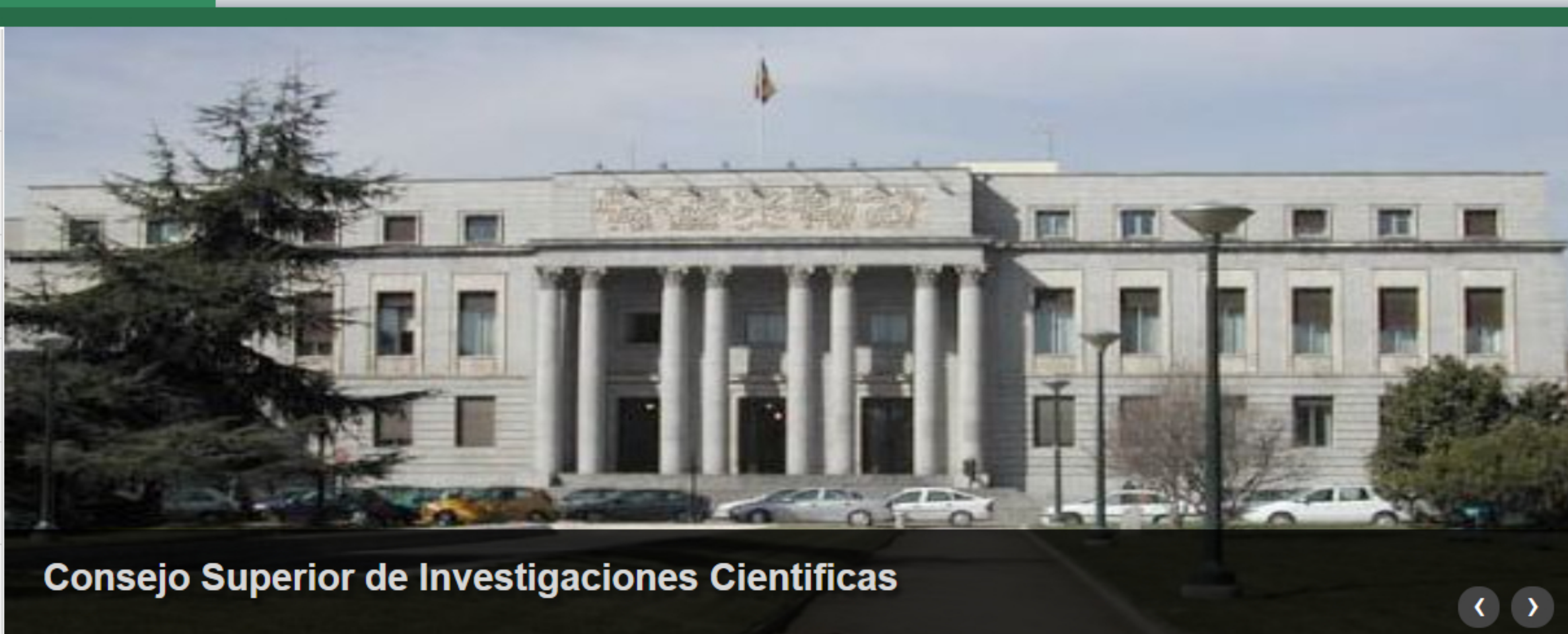
Consejo Superior de Investigaciones Cientificas