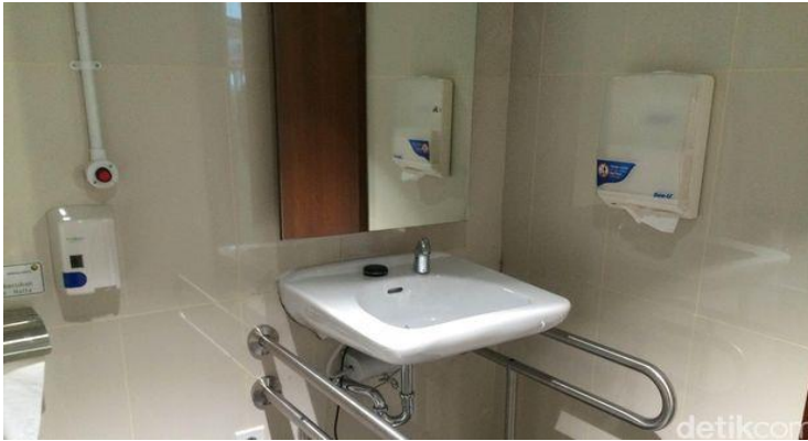
Wastafel Disabilitas

wastafel harus dipasang sedemikian rupa sehingga dapat membantu disabilitas bergerak dengan leluasa. Untuk faktor keselamatan, wastafel dilengkapi dengan pegangan tangan (handle)