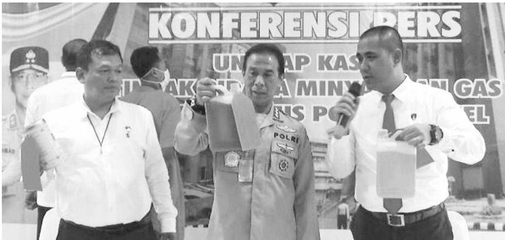
SP alias U, nekat menjual Bahan Bakar Minyak (BBM) dari minyak sulingan campuran jenis Peralite, diamankan Unit 1 Subdit IV Tindak Pidana Tertentu (Tipidter) Ditreskrimsus Polda Sumsel.

Setiba di TKP, tersangka yang memiliki toko manisan, sambil menjual Kios Pertamina menjual minyak Peralite, sedangkan di sebelah toko terdapat tempat penyimpanan dan pengelolaan minyak sulingan dari sumur tua di Musi Banyuasin (Muba), yang oleh tersangka SP di campur menggunakan bahan pewarna kimia jenis "Colour Sea Brand" bertuliskan "Solvent Brilliant Green". Sehingga menjadi BBM jenis pre-