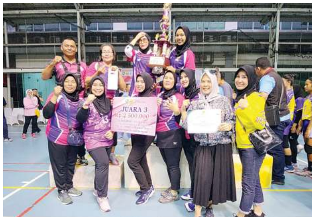
Perwosi Muba berhasil meraih juara 3 pada Tournament Volleyball Perwosi.

PALEMBANG, MEDIASRIWIJAYA —Persatuan Wanita Olahraga Seluruh Indonesia (Perwosi) Kabupaten Musi Banyuasin kembali menorehkan prestasi di ajang bergengsi. Kali ini, Perwosi Muba berhasil meraih juara 3 pada Tournament Volleyball Perwosi di lapangan volley Sekolah Harapan Palembang, Sabtu (17/06).