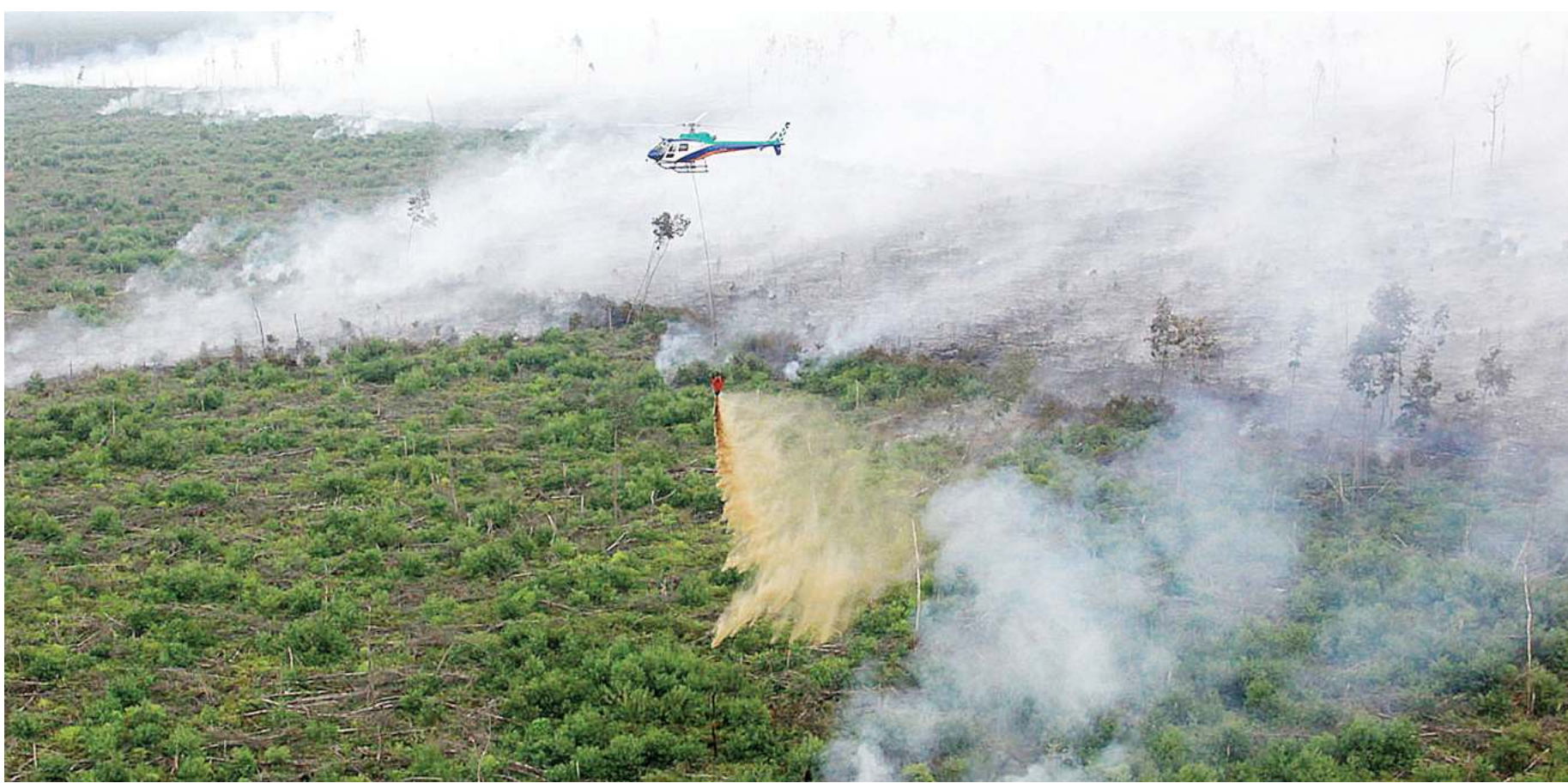
ILUSTRASI - Helikopter Badan Nasional Penanggulangan Bencana (BNPB) melakukan water booming untuk pemadaman lahan yang terbakar