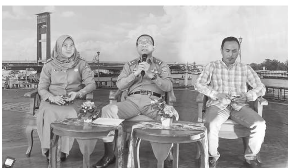
Festival Sriwijaya XXXI Tahun 2023 diselenggarakan di Plaza Benteng Kuto Besak Palembang, dari 22 hingga 26 Juni 2023.

"Di Festival Sriwijaya XXXI Tahun 2023 ini, pengunjung akan menyaksikan sekaligus menikmati berbagai suhunan antara lain pertunjukan Drama Teatrikal berjudul Sriwijaya Tangguh, Mandiri Pangan dan Sejahtera, gelar seni budaya dari Sumatera Selatan, bazaar UMKM dan ekonomi kreatif,