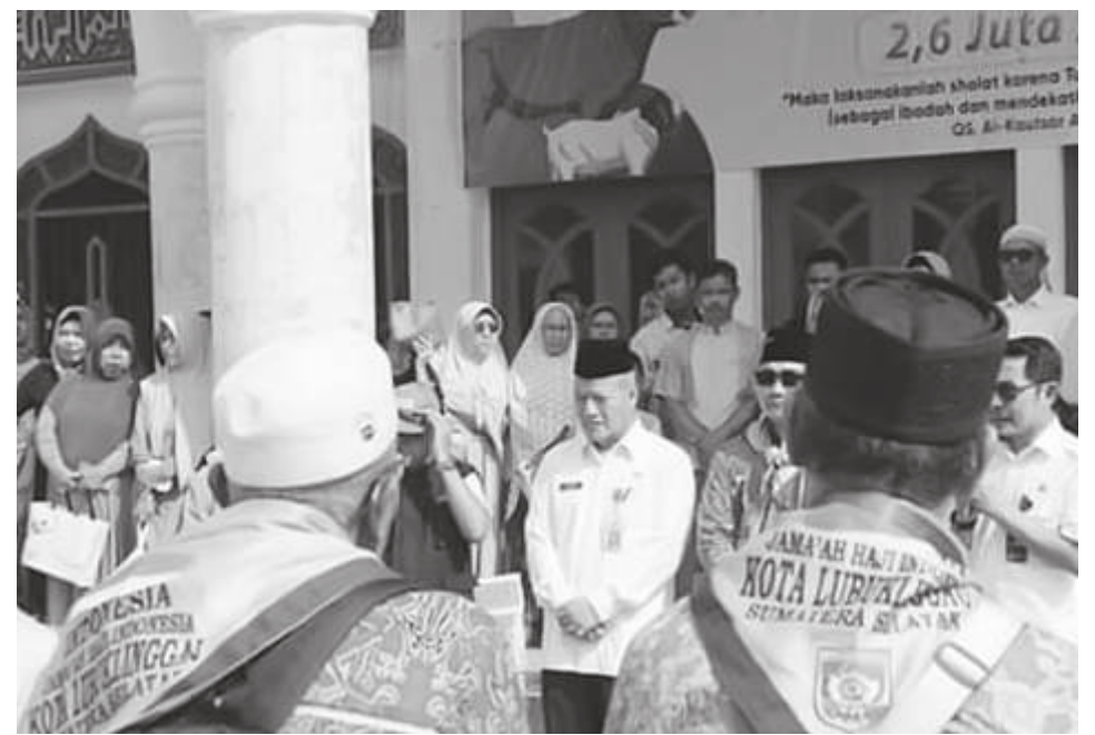
Sebanyak 13 orang Jamaah Calon Haji (JCH) Kota Lubuklinggau yang merupakan kuota tambahan Provinsi Sumsel telah diberangkatkan dari Kota Lubuklinggau.

Sementara itu, Kabupaten Musi Rawas telah melakukan soft launching MPP pada Desember lalu (12/22) dan menjadi daerah dengan MPP kedua se-Provinsi Sumsel. (mud)