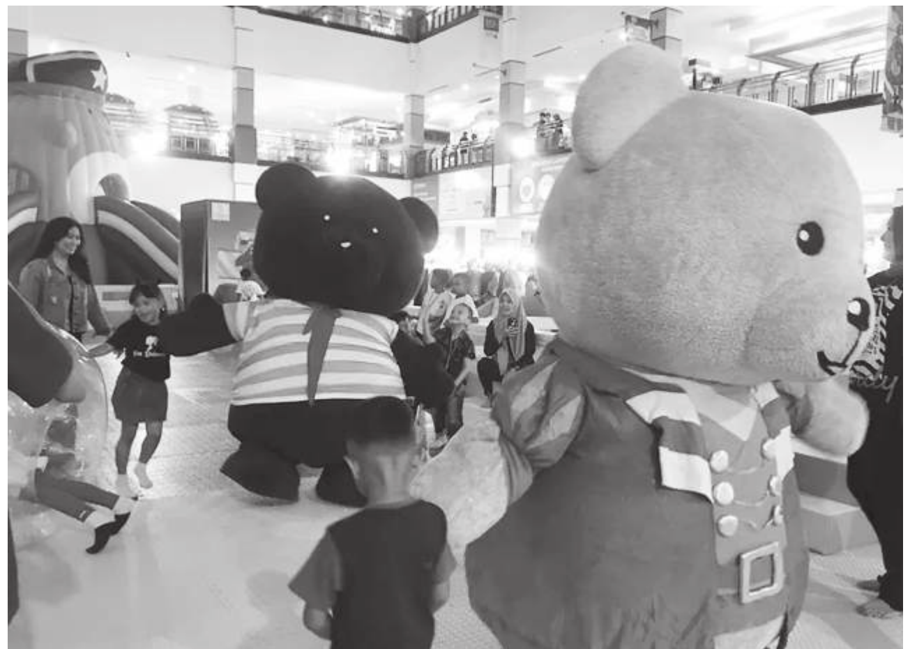
Bear Pirates salah satu pertunjukan yang bisa dinikmati pengunjung wahana.

Dia mengatakan, tak hanya bermain, tapi disini juga memberikan hadiah doorprice berupa uang tunai, tiket, marchendes bagi yang beruntung mendapatkan bola berhadiah di kolam bola."Jadi kita memberikan doorprice yang ditempatkan dibola, jadi siapa beruntung ia akan dapat."(*)