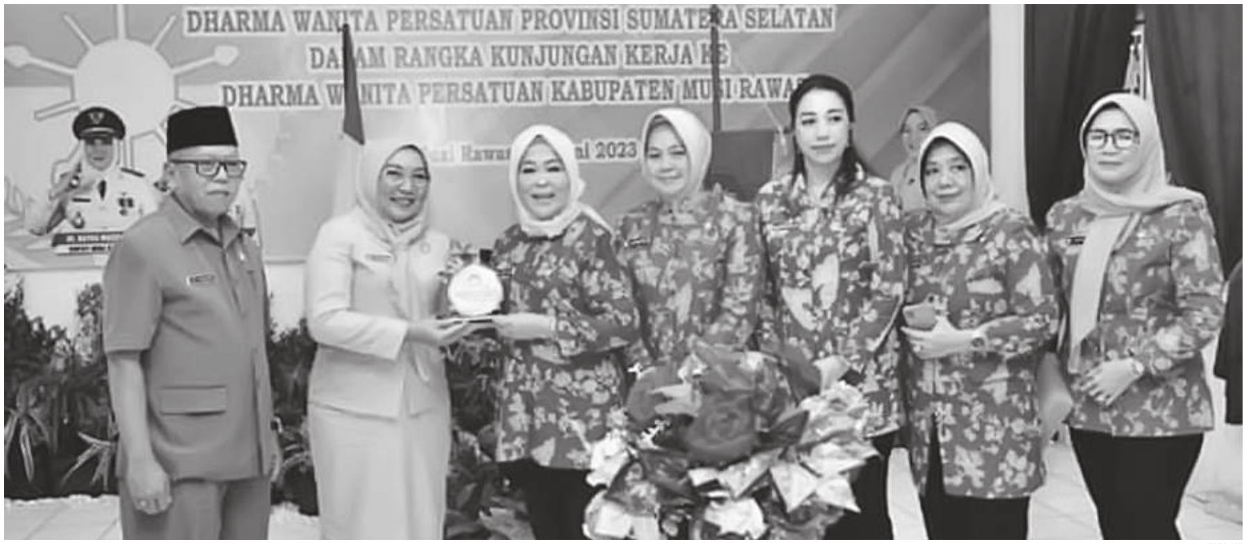
Kunjungan Kerja Pengurus Dharma Wanita (DW) Provinsi Sumatera Selatan di Sekretariat Dharma Wanita Persatuan (DWP) Kabupaten Musi Rawas.

Tim 5 DW Sumsel meninjau Kebun DW Musi Rawas yang ada di belakang Kantor Sekretariat DW Musi Rawas, dan melihat produk yang dihasilkan DW Kabupaten Musi Rawas. (mud)